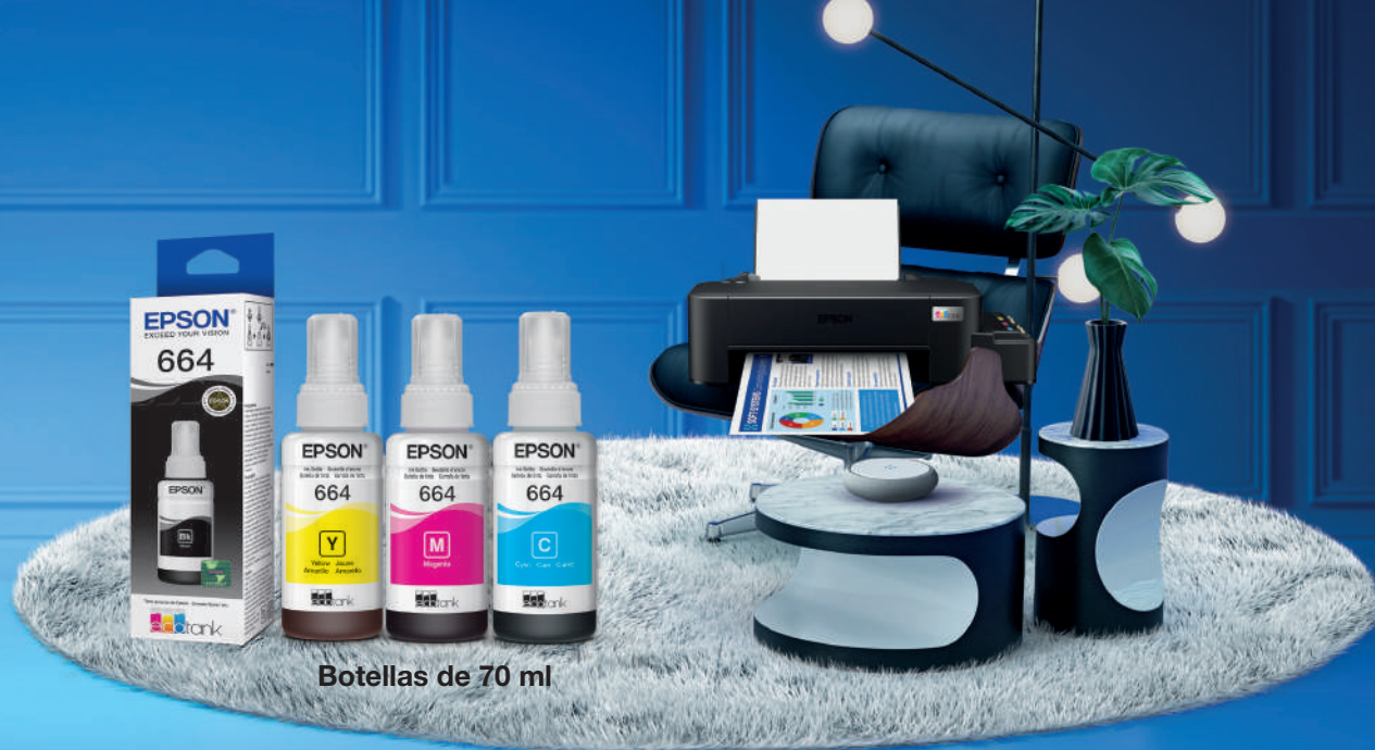
Botellas de 70 ml

Mantenga su EcoTank® 100% Epson con tintas originales.